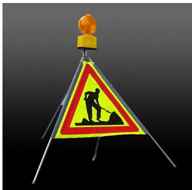
Voidaan varustaa NISSEN Nitra-vilkuilla (lisävaruste)