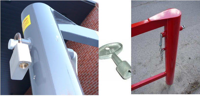
Kolmioavainriippulukko 702091) ja avain 702092.